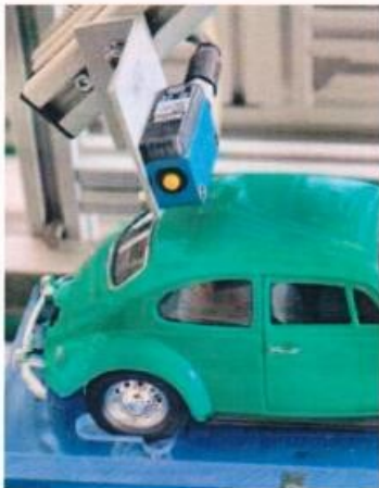
Sogar Farbsensoren kommen in Anlagen von Topik Didaktik zum Einsatz.