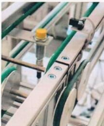
Ob RFID-Chip oder Reed-Kontakt – Topik Didaktik erklärt modernste Technik.

Damit ein abwechslungsreiches „Anlagenleben“ gegeben ist, sind von Topik Didaktik unterschiedliche Module zu bekommen, mit denen Fläschchen gefüllt, Bauklötze ineinandergesteckt und VW-Käfer-Modellautos montiert werden können. Diese sind mit allerlei raffinierten Ideen versehen, damit die Montage problemlos ablaufen kann. So wird beispielsweise die Karosserie eines VW-Käfers per Magnet mit dem Chassis verbunden, sodass keine komplizierten Schraubarbeiten auszuführen sind. Schließlich geht es