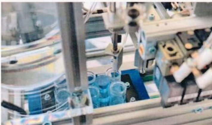
Auch für die chemische Industrie sind die Lösungen von Topik Didaktik interessant, da damit die Abläufe in einer derartigen Fertigung nachbildbar sind.