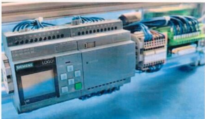
Ob Logo! oder S7 – die Macher von Topik Didaktik legen großen Wert auf SPS-Hardware, die eine weite Verbreitung in der Industrie besitzt.

Begeistert und Aha-Effekte auslösend ist, dass die Entwickler des Systems die Magnete nicht planlos auf den Paletten verteilt haben, sondern die Platzierung nach dem Binärsystem vornahmen. Auf diese Weise ist es möglich, das Binärsystem anschaulich zu präsentieren: Die in den Paletten vorhandenen vier Bohrungen können durch Hinzufügen und Entfernen kleiner Magnete die Wertigkeit von Null bis Fünfzehn annehmen, wobei die Null durch die Dualzahl 0000 und die Fünfzehn durch die Dualzahl 1111 dar-