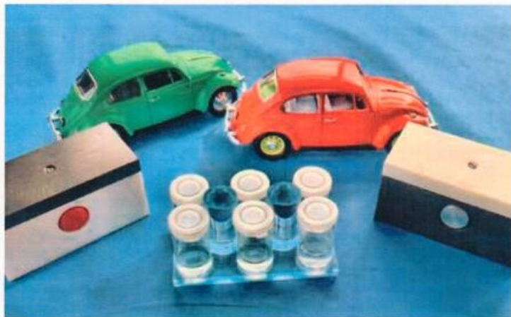
Die »Lernfabrik Industrie 4.0« wartet mit sehr flexiblen Modulen auf, mit denen es möglich ist, unterschiedlichste Prozesse einer realen Fabrikanlage zu simulieren.

gestellt wird. Auf diese Weise kann einer SPS-Steuerung mitgeteilt werden, welcher von 16 Artikeln auf der Palette vorhanden ist. Diese wiederum wird dadurch in die Lage versetzt, die passenden Paletten für eine folgerichtige Montage in der richtigen Reihenfolge zur richtigen Zeit am richtigen Anlagenplatz zu dirigieren.