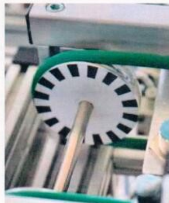
Encoderscheiben eignen sich bestens, um Signale zu erzeugen.