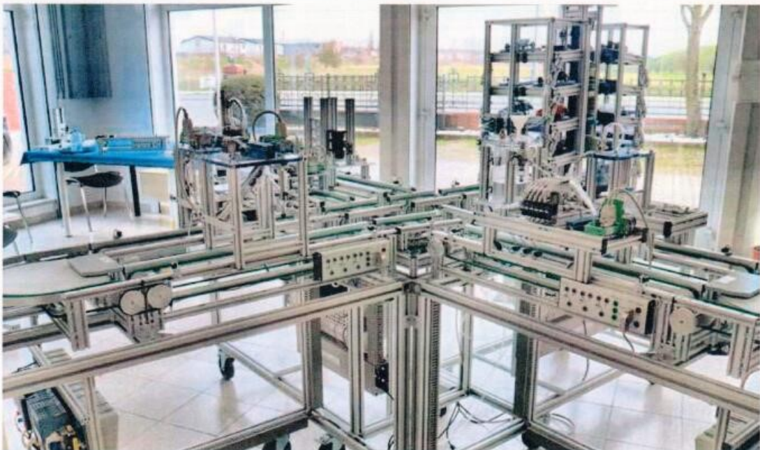
Die ›Lernfabrik Industrie 4.0‹ von Topik Didaktik ist bestens für die Aus- und Weiterbildung in Sachen ›Automatisierungstechnik‹ geeignet, da hier Industriekomponenten und weit verbreitete SPS-Steuerungen zum Einsatz kommen.

Im Grund genommen steckt hier die Idee von Lego dahinter, aus zahlreichen Steinen unterschiedlichste Objekte zu erschaffen. Dass es sich hier jedoch nicht um ein Spielzeug handelt, wird an den verwendeten Komponenten ersichtlich, die ausschließlich aus dem Industriesektor stammen. Das mit einer Topik-Anlage