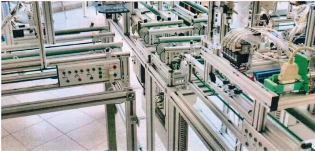
Dank eines Modulsystems können einfache Grundelemente zu umfangreichen Anlagen zusammengestellt werden, auf denen reale Fabrikabläufe simuliert werden können.

erworbene Wissen kann daher nach der Ausbildung direkt eingesetzt werden, da die Handhabung der Bausteine sich nicht von den in der Industrie vorzufindenden Bausteinen unterscheidet.